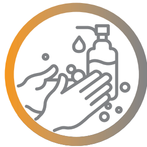
le lavage des mains

L'équipement de protection individuelle est une mesure de prévention supplémentaire et non pas un substitut aux impératifs suivants :