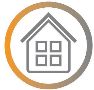
l'isolement à la maison si vous êtes malade