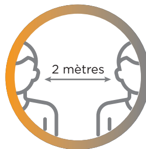
la distanciation physique